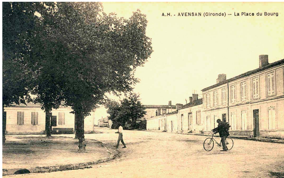
A.H. - AVENSAN (Gironde) - La Place du Bourg

de MARGAUX pour la chasse car ils veulent bien une réciprocité, à condition que les chasseurs d'AVENSAN ne viennent pas chez eux les jours de lâchers.