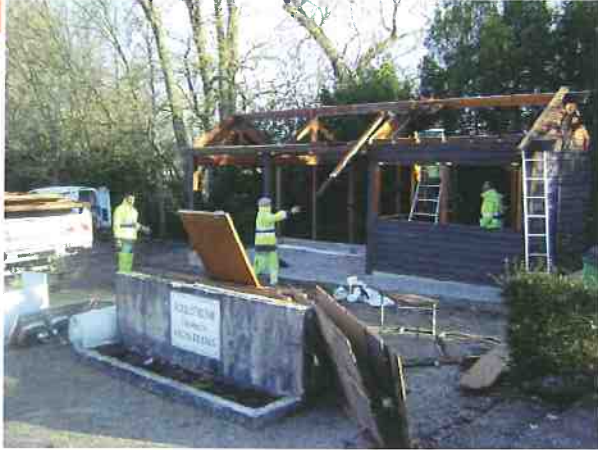
Démontage de la cabane du boulodrome en vue de la viabilisation du terrain en trois lots.