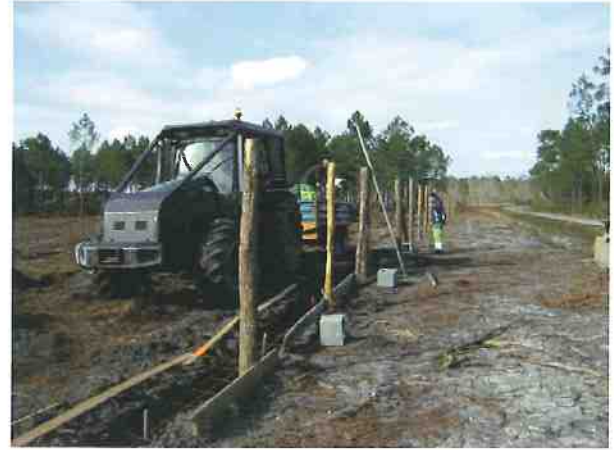
Réalisation de la clôture et d'un portail sur la plaine de Puiberron.

Parallèlement les dossiers de « loi sur l'eau et de défri-chement » ont été remis pour validation aux services de la police de l'eau. Ce sont deux dossiers complexes, importants et dont l'acceptation conditionne la poursuite du projet. Un point majeur est la compensation de