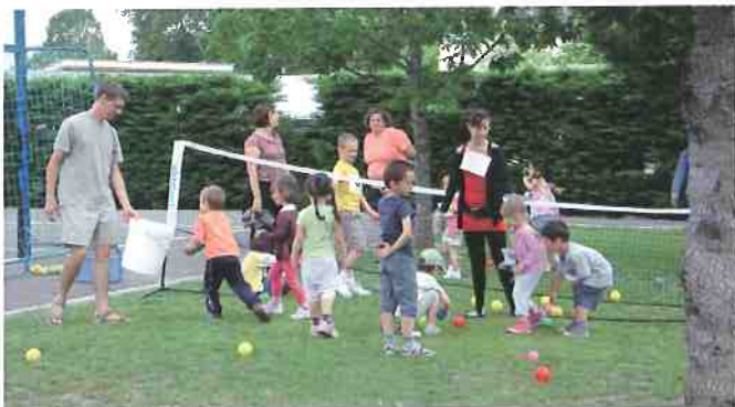
Le jeudi 31 mai, les élèves de l'école maternelle ont participé à leur première olympiade.