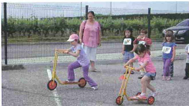
16 équipes de 6 à 7 enfants, mélangeant les petits aux plus grands ont pu réaliser de belles prouesses sportives. Lion, gazelle, zèbre ...ont pu se mesurer à la course en sacs, aux parcours d'obstacles, lancer de balles, course de trottinettes...dans une très bonne ambiance.